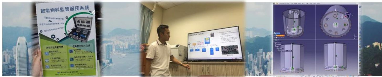
智能物料監管服務系統